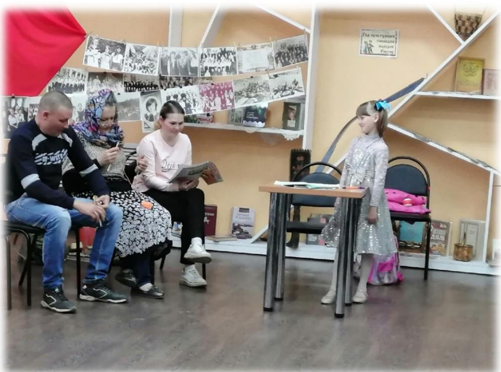
Районная детская библиотека