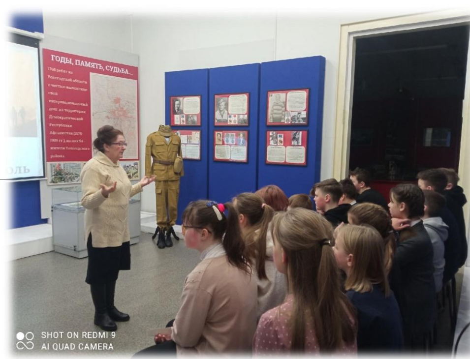
Районный краеведческий музей